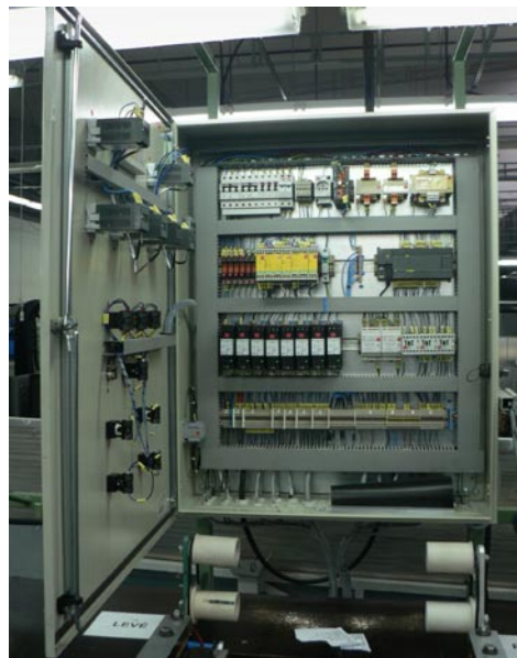
Linka 7 - rozvaděč lepičky profilů

Nově instalovaná vytlačovací linka č. 7 v Červeném Kostelci je společným dílem všech složek technického úseku.