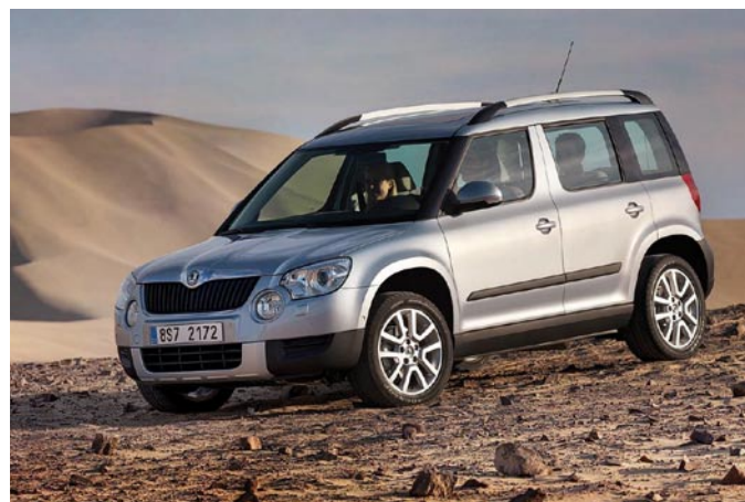
Škoda Yeti

Tuzemský automobil si ale vedl dobře i v dalších anketách, v Rakousku a Švýcarsku získal ocenění Zlatý volant magazínu Auto Bild, v Německu pak titul časopisu Auto Thropy.