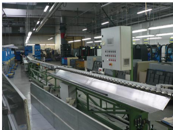
Linka 7 - online spojování