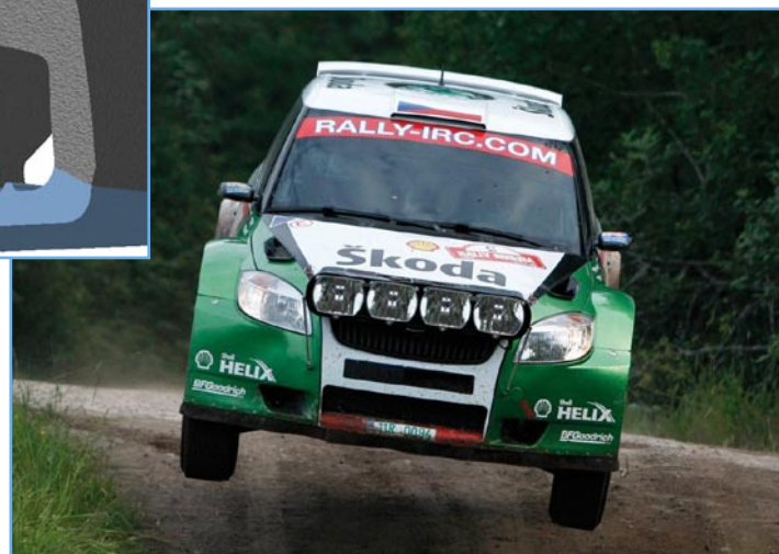
Škoda Fabia Super 2000